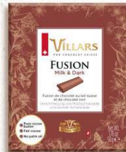
Fusion Milk & Dark