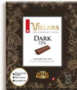
Dark Pure 72%